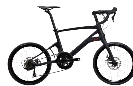
CARACLE-COZ R7000(105)ライトモデル r1.2 約7.8kg