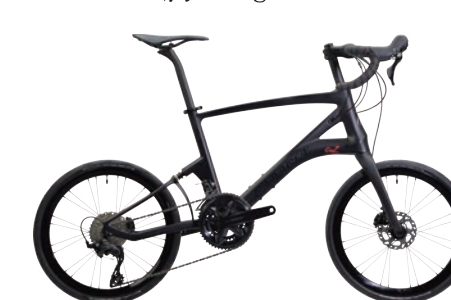
CARACLE-COZ R7100(105)機械式モデル r1.1 約7.8kg