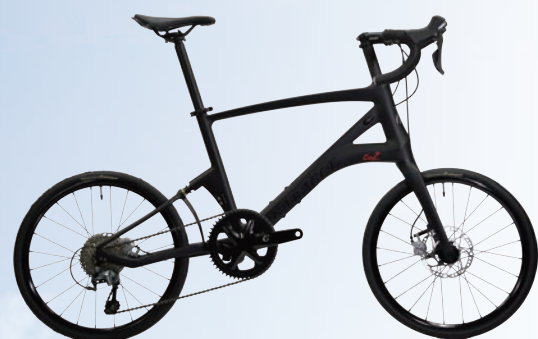
CARACLE-COZ 4700(Tiagra)基本モデル r1.2