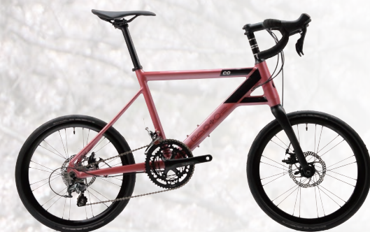
Chalet-coz rev.0 Drop