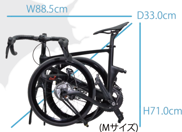
CARACLE-COZ R8100(アルテグラ)モデル r1.0

「折りたたみロードバイク」と呼ぶのに相応しい高次元の走行性能を追い求めて生み出された、CARACLE-COZ。ディスクブレーキや電動変速Di2などの最先端規格にも対応し、フレーム素材やパーツ類にカーボンファイバーを採用したことで、最軽量モデルはディスクブレーキにも関わらず7.4kgを実現。