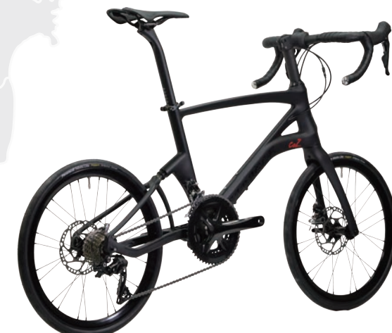
CARACLE-COZ R7000(105)ライトモデル r1.2

「折りたたみロードバイク」と呼ぶのに相応しい高次元の走行性能を追い求めて生み出された、CARACLE-COZ。ディスクブレーキや電動変速Di2などの最先端規格にも対応し、フレーム素材やパーツ類にカーボンファイバーを採用したことで、最軽量モデルはディスクブレーキにも関わらず7.4kgを実現。