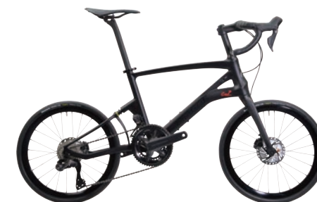
CARACLE-COZ R8100 (アルテグラ)モデル r1.0 約7.4kg