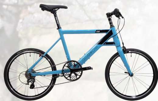
Chalet-coz rev.0 Flat