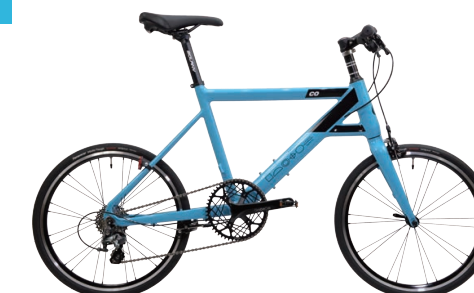
Chalet-COZ 10 FLATモデル 約8.3kg