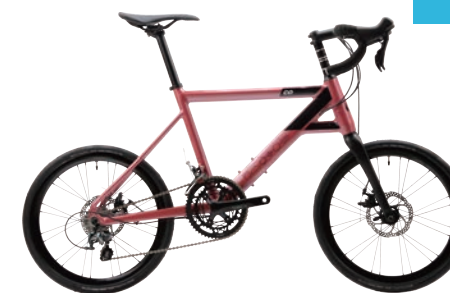
Chalet-COZ 10 DROPモデル 約9.0kg