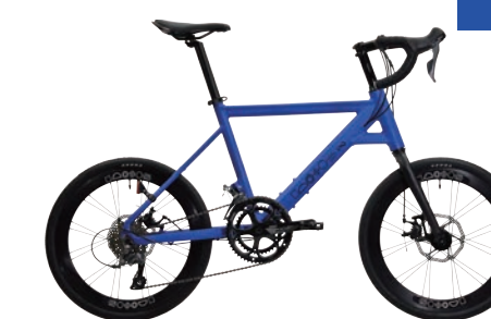
Chalet-COZ 8 約10.8kg

TECH 開発・製造・販売 株式会社テック・ワン 〒580-0042 大阪府松原市松ヶ丘4-20-12 www.caracle.co.jp