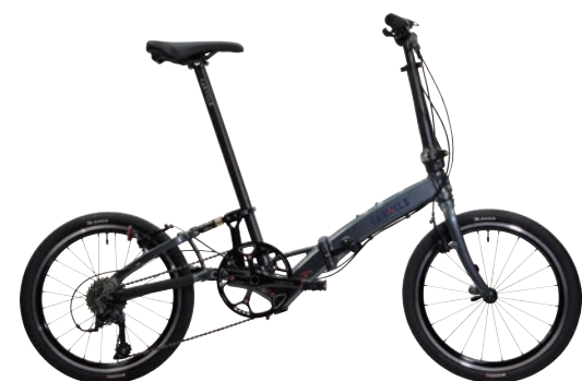
CARACLE-S 標準モデル rev.4.2 約10.3kg