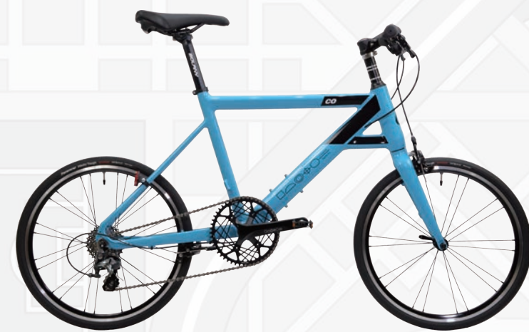
Chalet-coz 10 Flatモデル

ワンタッチでハンドルバーが90度横に向き、収納時に横幅を取らないスマートスタイル。8.3kgで女性にも優しく、1DKの玄関でも邪魔になりにくいバイク。