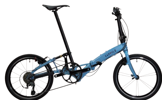
CARACLE-S スポーツモデル rev.4.3 約9.55kg