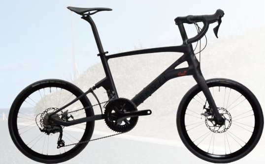
CARACLE-COZ R7000(105)ライトモデル r1.2