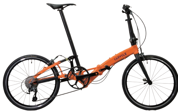
CARACLE-S 451FLATモデル rev.4.3 約9.5kg