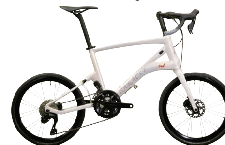
CARACLE-COZ R7100(105)Di2 モデル r1.1 約7.6kg