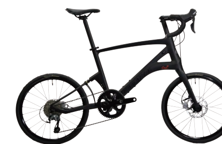
CARACLE-COZ 4700(Tiagra)基本モデル r1.2 約8.7kg