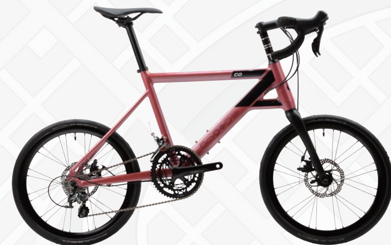
Chalet-coz 10 Dropモデル

ワンタッチでハンドルバーが90度横に向き、収納時に横幅を取らないスマートスタイル。8.3kgで女性にも優しく、1DKの玄関でも邪魔になりにくいバイク。