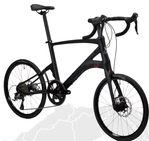
CARACLE-COZ 4700(Tiagra)基本モデル r1.2

折りたたみ操作が簡単な1×10速仕様で、新たにシマノTiagraシリーズを採用。よりリーズナブルな価格設定を実現したモデル。