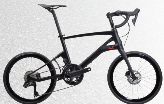
CARACLE-COZ R8100(アルテグラ)モデル r1.0