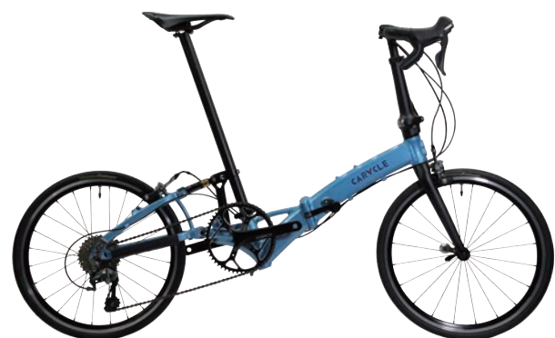
CARACLE-S 451RSモデル rev.4.3 約9.75kg